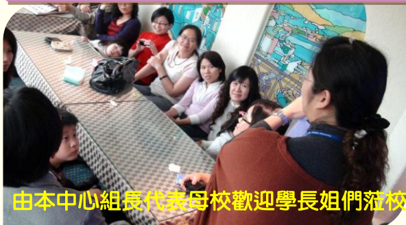
由本中心組長代表母校歡迎學長姐們蒞校