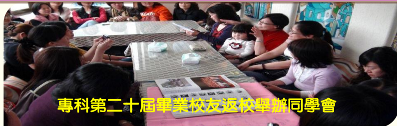
專科第二十屆畢業校友返校舉辦同學會