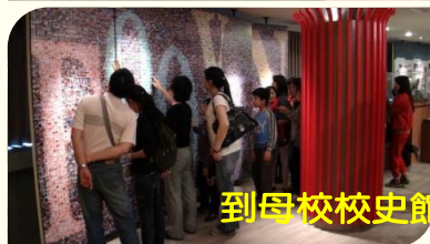
到母校校史館看看走走