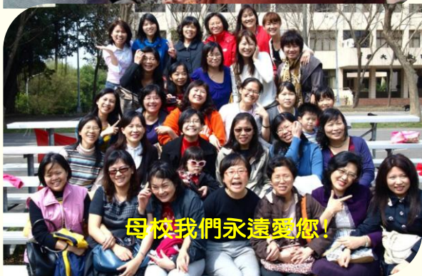
母校我們永遠愛您！