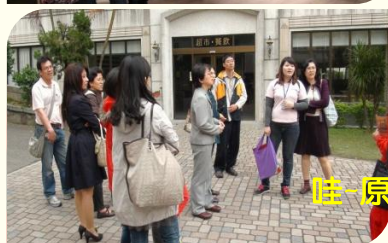
哇～原來媽媽的學校有養天鵝呢！